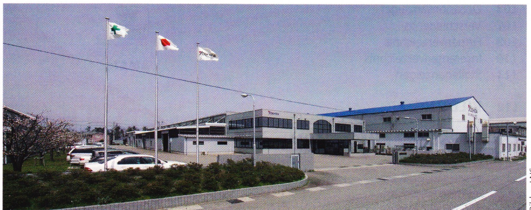
Der Sitz von LNS Yoshida KK im japanischen Nomi.