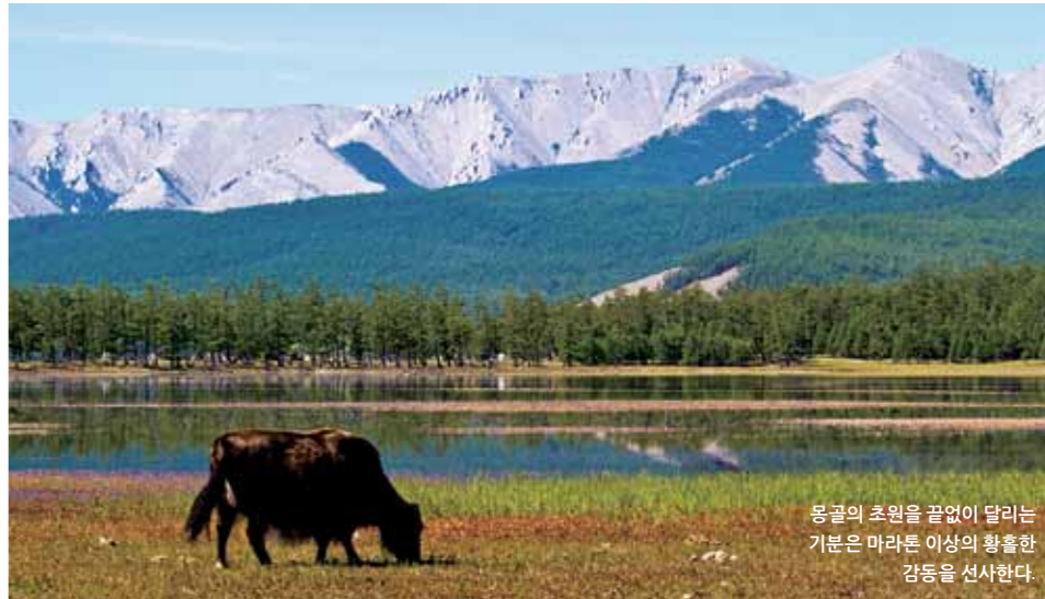
몽골의 초원을 끝없이 달리는 기분은 마라톤 이상의 황홀한 감동을 선사한다.