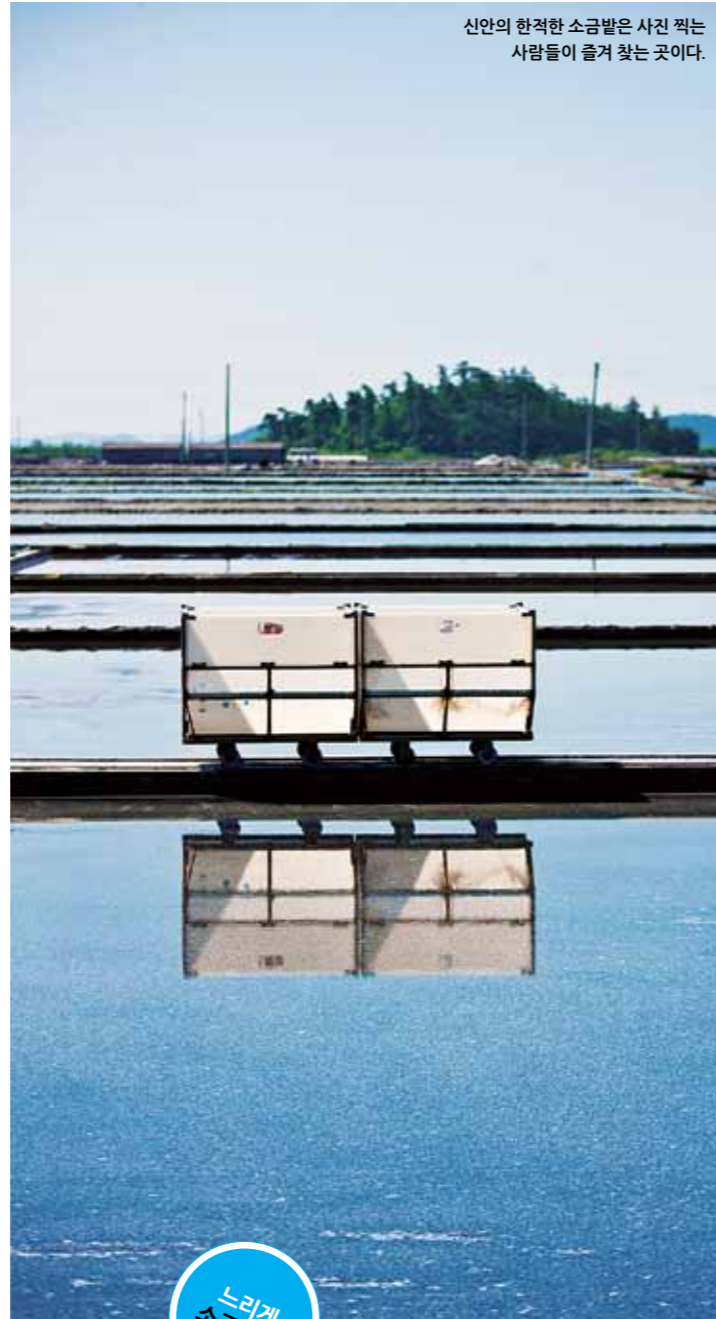
신안의 한적한 소금밭은 사진 찍는 사람들이 즐겨 찾는 곳이다.