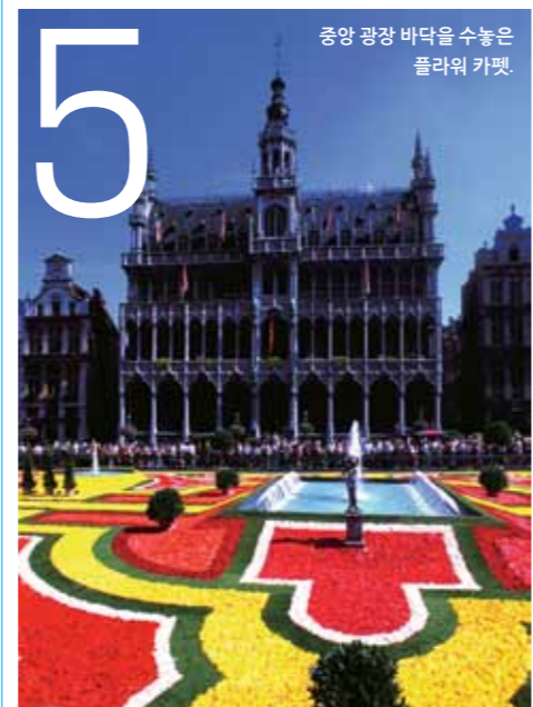
중앙 광장 바닥을 수놓은 플라워 카펫.

어떻게 여행하면 좋을까? ★ 대한항공이 인천국제공항에서 프랑크푸르트를 경유해 브뤼셀국제공항으로 가는 항공편을 운항한다. 202만7,700원, kr.koreanair.com ★ 올해의 플라워 카펫은 8월 15일부터 19일까지 오전 9시부터 밤 11시까지 전시한다(19일은 오후 6시까지). 14일 밤에 열리는 전야제 행사는 빼놓지 말아야 할 하이라이트. ★ 빈티지 호텔(Vintage Hotel)은 플라워 카펫 행사가 열리는 중앙 광장에서 10분 거리에 있는 디자인 부티크 호텔이다. 객실에는 빈티지 소품을 곳곳에 배치했다. 80유로부터, vintagehotel.be