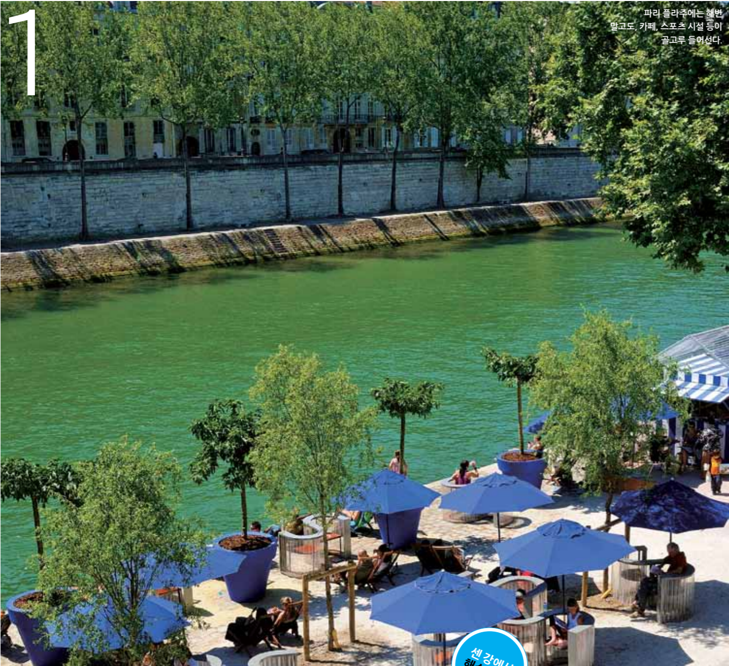
파리 플라주에는 해변 말고도, 카페, 스포츠 시설 등이 골고루 들어선다.