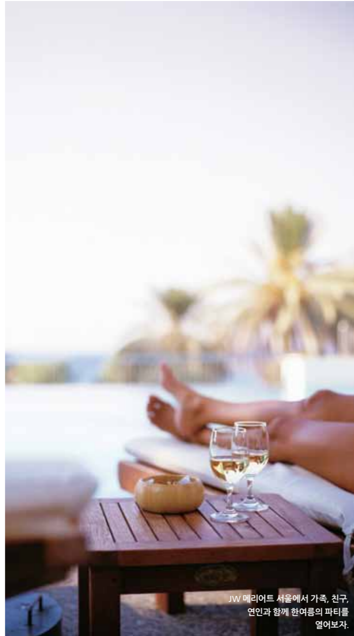
JW 메리어트 서울에서 가족, 친구, 연인과 함께 한여름의 파티를 열어보자.