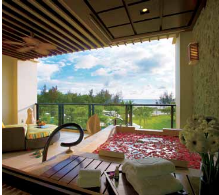
상그릴라 라사리아 리조트는 코타키나발루 내에서도 한적한 곳에 위치해 신혼여행객에게도 인기가 좋다.