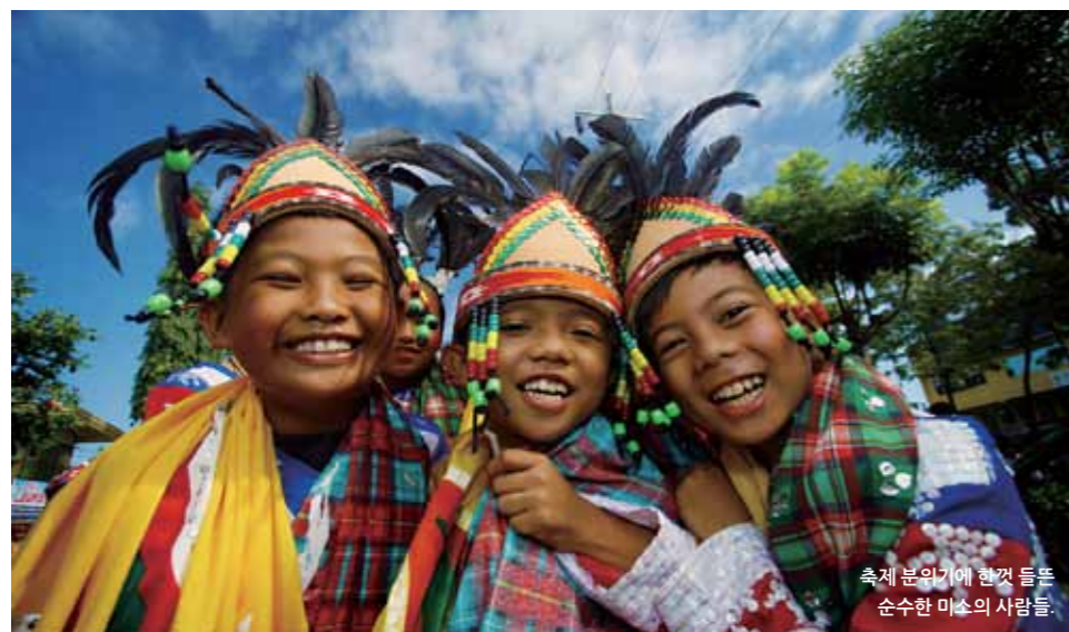
축제 분위기에 한껏 들뜬 순수한 미소의 사람들.