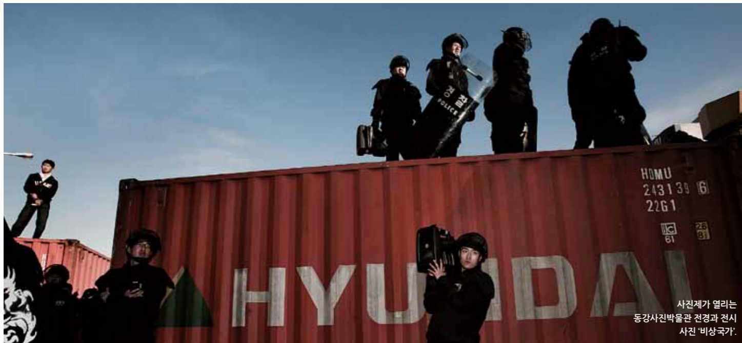
사진제가 열리는 동강사진박물관 전경과 전시 사진 '비상국가'.