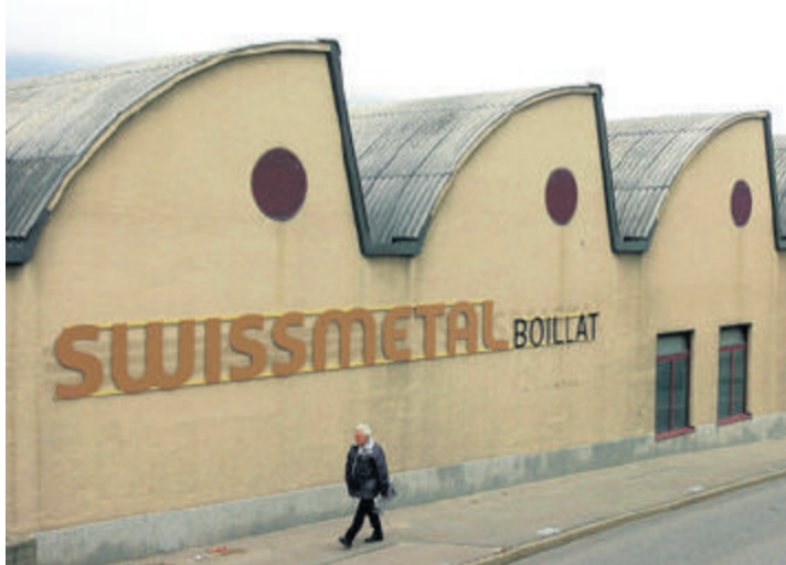
L'usine de Swissmetal à Reconvilier vient d'être rachetée par le groupe de la province de Shandong, Baoshida.

Selon la promotion économique de la région romande et de Berne (GGBa), plus de 60 entreprises d'une certaine taille de l'Empire du Milieu sont actuellement