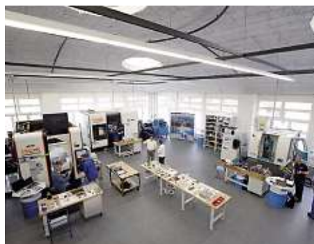
Pohled do moderního technologického centra firmy Blaser Swisslube, podnikající v oblasti maziv.