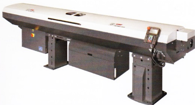
Auf der Fachmesse EMO in Hannover präsentierte LNS das neue Stangenladegerät Alpha 552 das erste Mal in Europa.