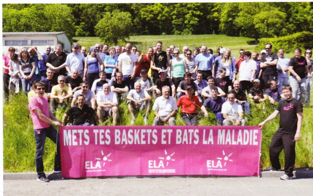
Luftfilteranlagen, im Bild die Fox-SC500-Abblas-Filterkabine, gehören zum Produktportfolio der LNS Group.

Heute ist die LNS Group nach eigenen Angaben Weltmarktführer bei der Automation von Werkzeugmaschinen. «Wir unterstützen unsere Kunden mit einer breiten Palette an Peripheriegeräten, um ihre Effizienz in allen Kernmärkten zu optimieren. Und wir wollen