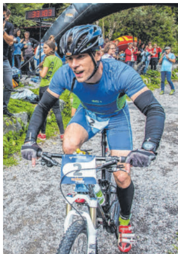
Berglauf-Weltmeister Petro Mamu beim Start. Rechts: Die Mountainbiker mussten teils extreme Steigungen zurücklegen.